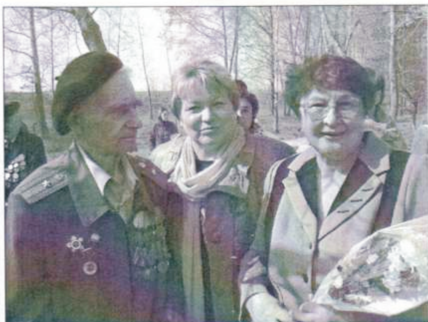
9 мая 2009 г.