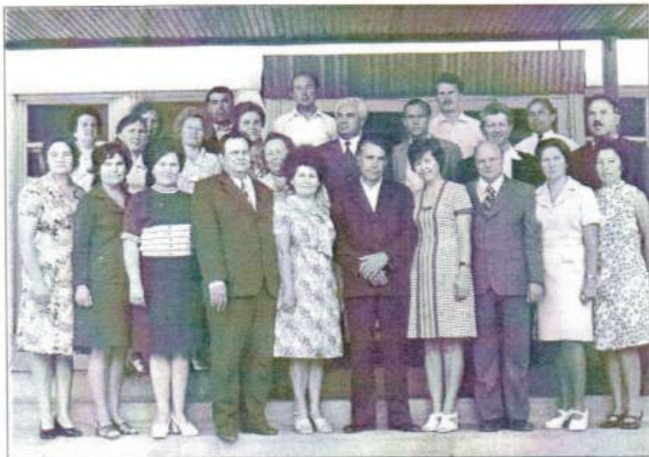
Педколлектив школы в 1970 г.