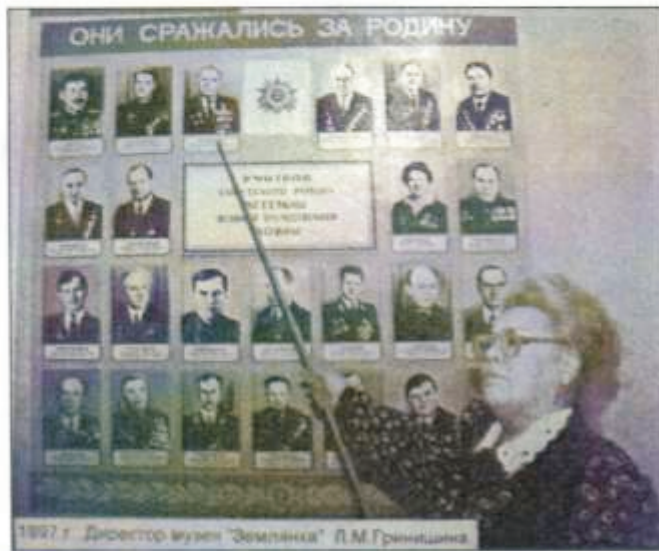
В школьном музее

регу Обского водохранилища. Аллею основали в канун 20-летия Победы. Там был сооружен памятник воинам-сибирякам. Аллею высаживали всем миром: учащиеся и педагоги школы, жители нового микрорайона. Она существует и поныне. Там наш пост № 1.