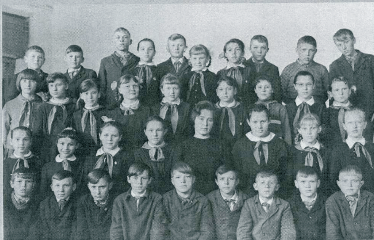
Классный руководитель, учительница русского языка и литературы восьмилетней школы № 2 г. Тогучина