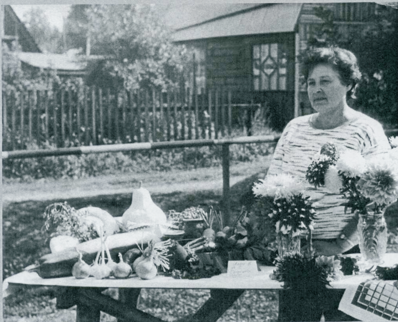
Дача, отдых, урожай