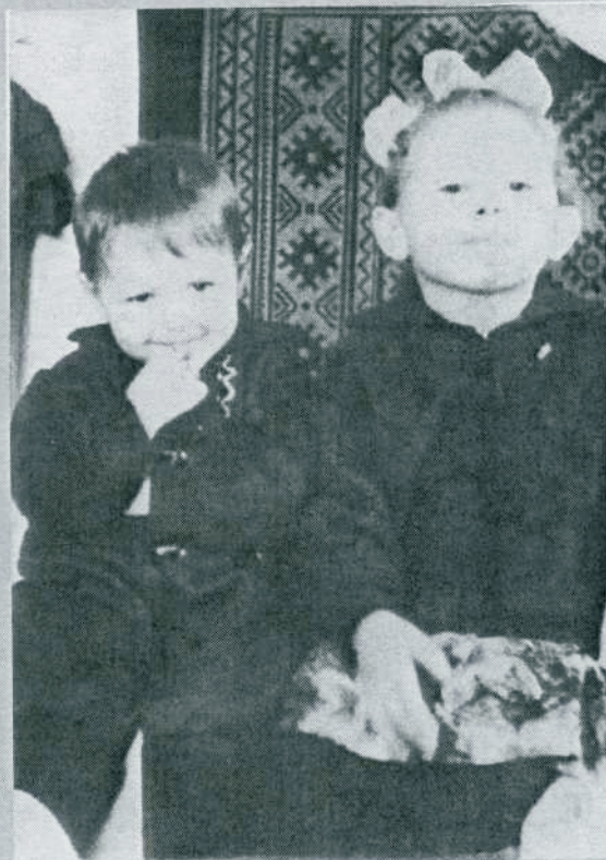
Как можно не радоваться, глядя на них?