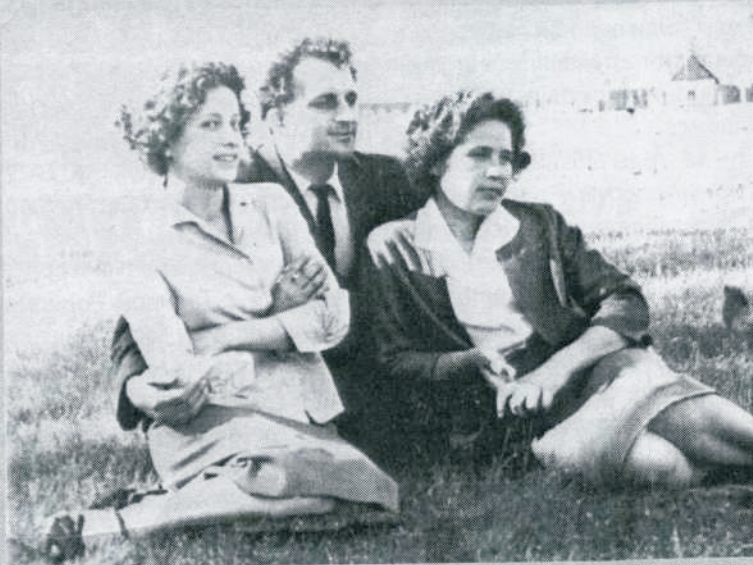
г. Минусинск, РК ВЛКСМ, 1963 г.