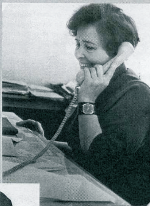
В областном институте усовершенствования учителей