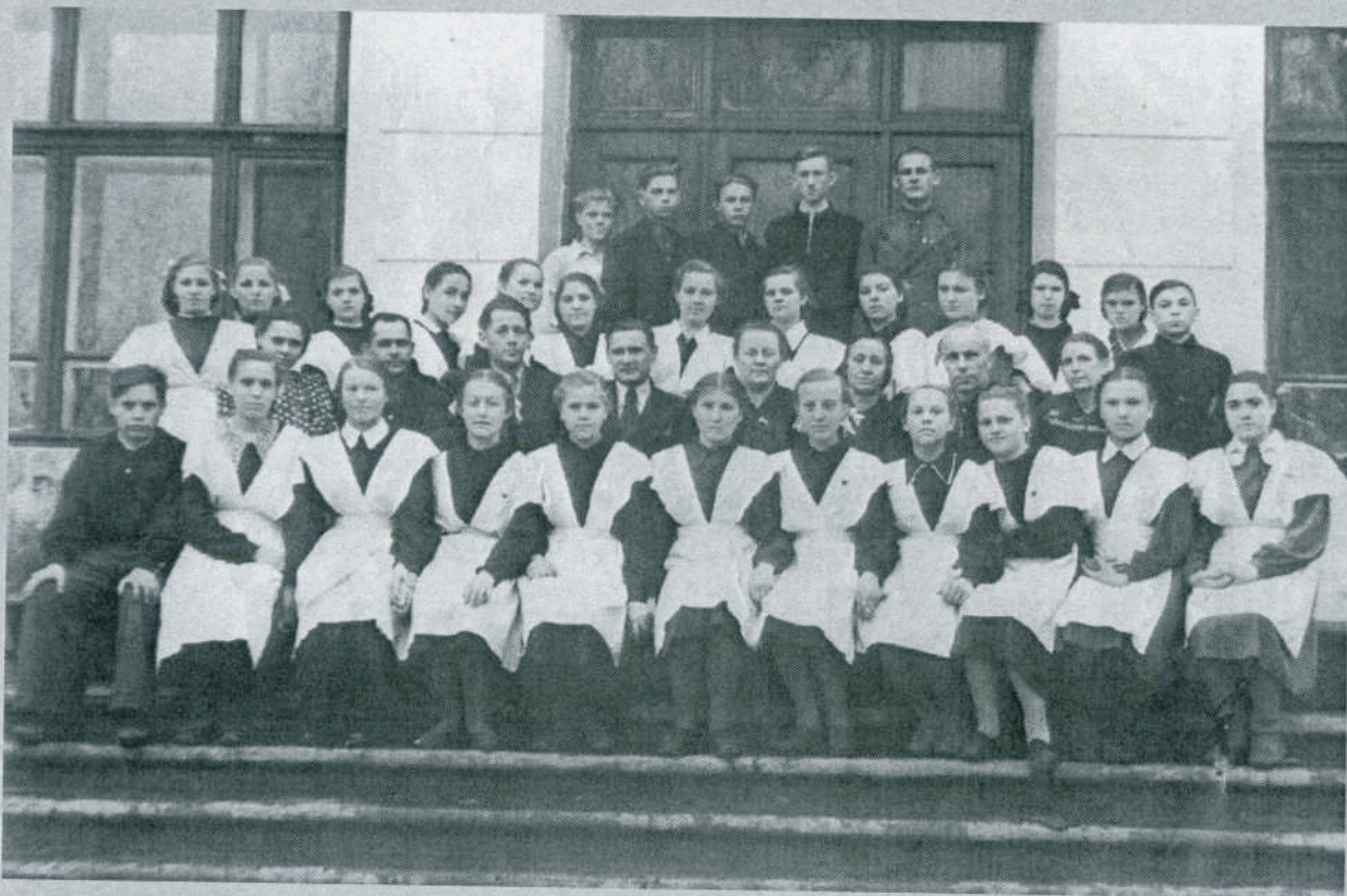
Выпускной класс Тогучинской средней школы № 51