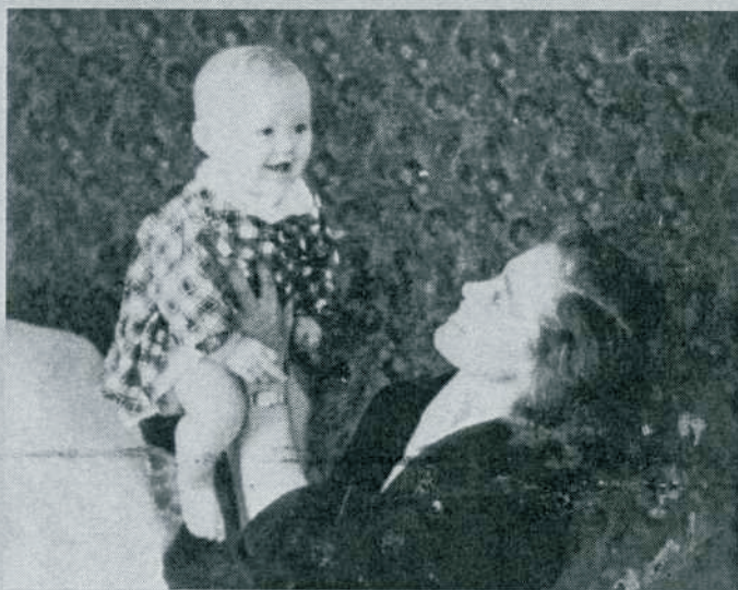
Уж и дети подрастали...