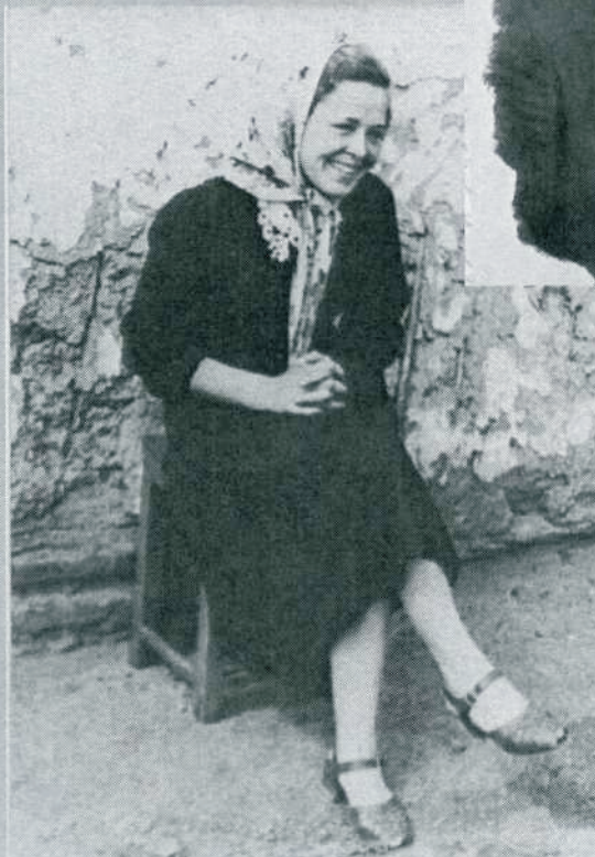
Возле стен родного дома