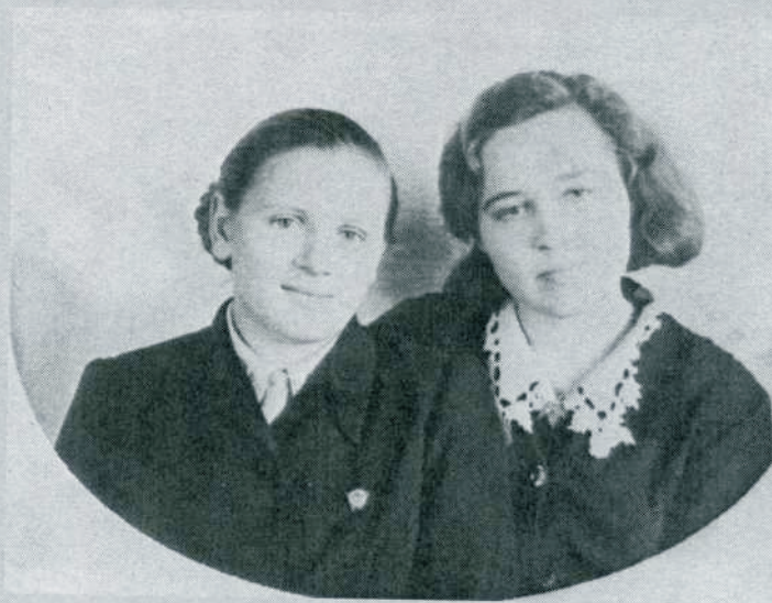
Годы учебы в Куйбышевском педагогическом училище