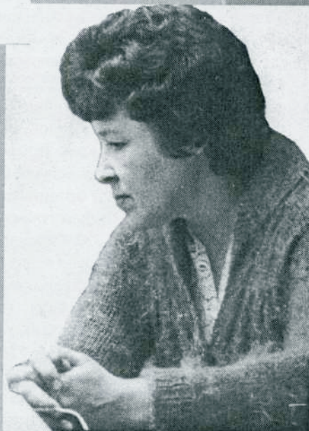
Здравствуй, горком профсоюза!