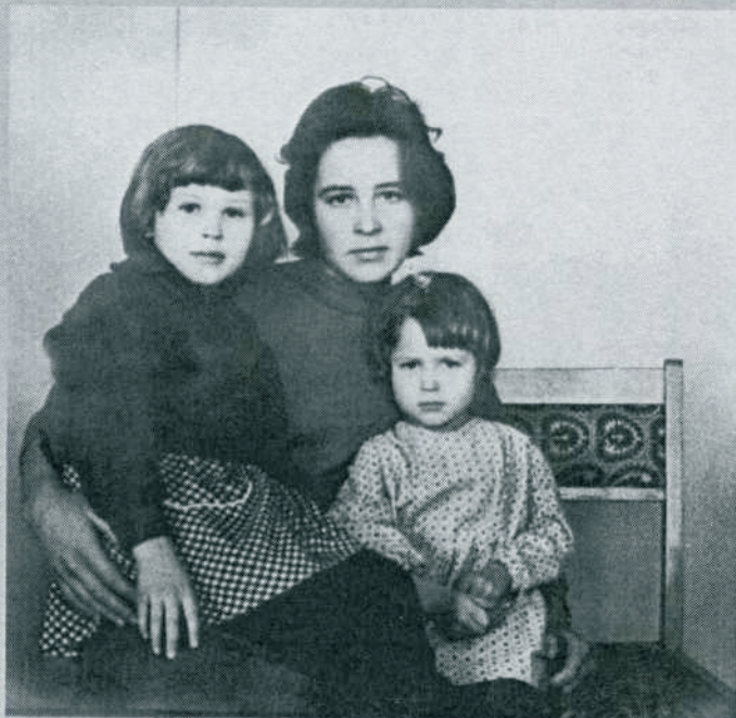
Вот уже и школьницы