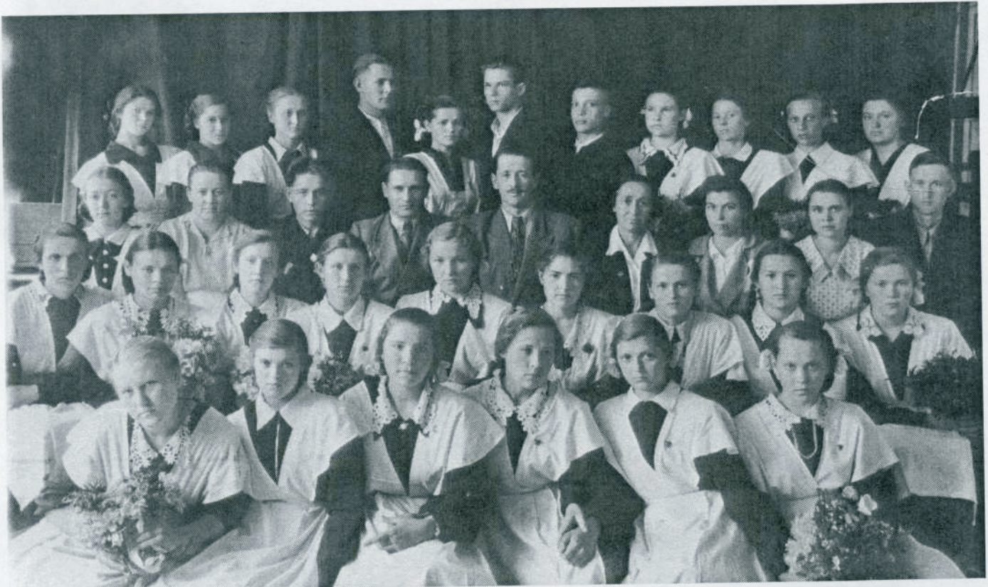
Мы окончили среднюю школу № 51 в Тогучине. Фото перед выпускным вечером. 10 «А» класс, 1956 г.

Учились мы хорошо, без троек. Стипендию 180 руб. платили только хорошистам, а она была для нас единственным средством существования. Помощи ждать было неоткуда. Приезжая домой на каникулы, мы обязательно всем членам своей семьи привозили. С этой целью после занятий лопатили зерно на элеваторе. И без подарков ни разу не приезжали.